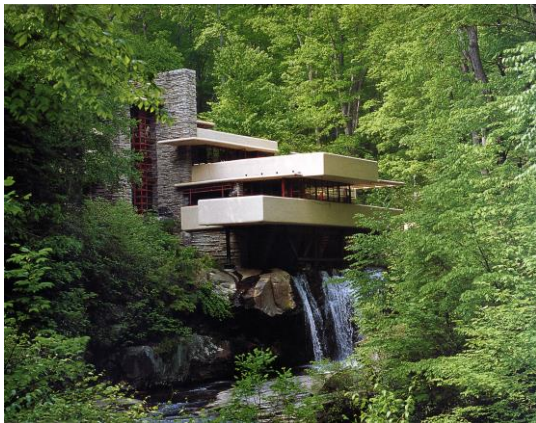
2A. F. Lloyd Wright: Casa de la cascada . 1936.