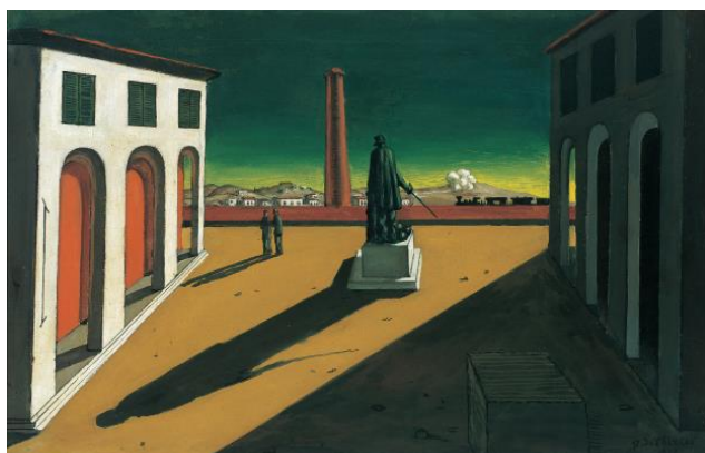
2A. G. de Chirico: Piazza . 1913.