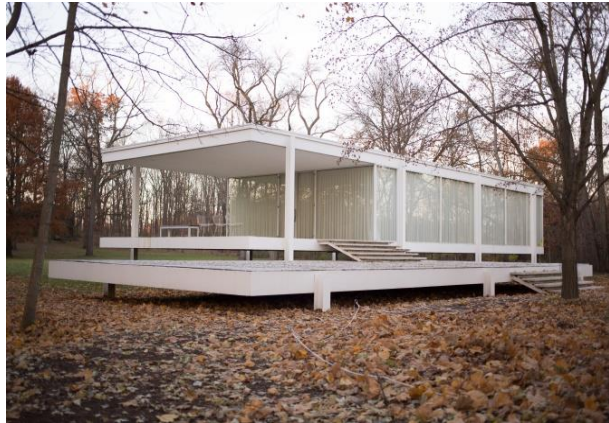
2B. M. van der Rohe: Casa Farnsworth . 1946